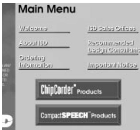
Sl.1 Osnovni meni

Sve veći razvoj telekomunikacija uslovio je potrebu za skladištenjem, prenosom i procesiranjem glasovnih poruka što je firma Information Storage Devices uočila i krenula u razvoj "govornih čipova". Trenutno je dostignuto vreme od 8 minuta snimanja glasa u jednom čipu..