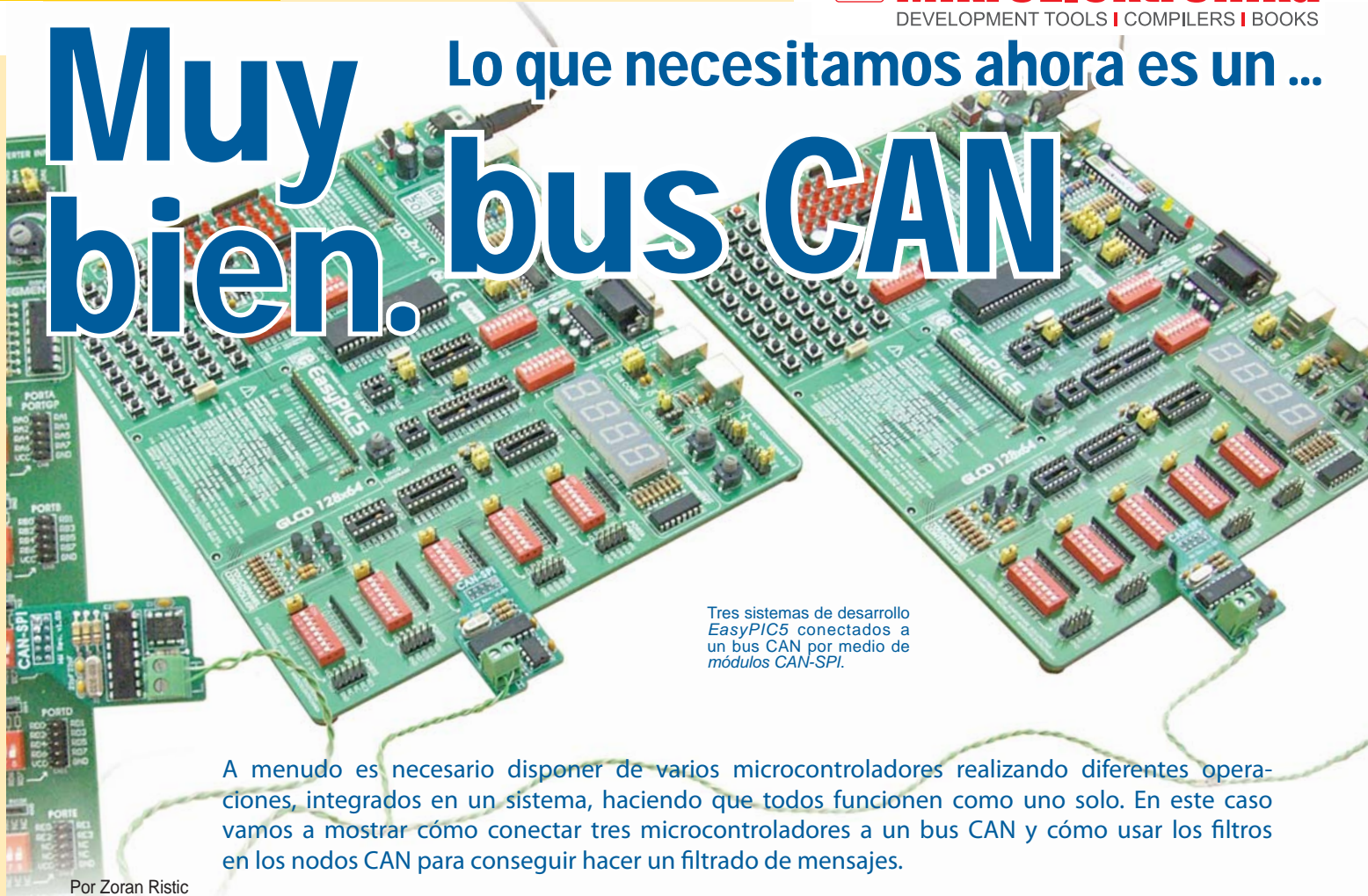
Tres sistemas de desarrollo EasyPIC5 conectados a un bus CAN por medio de módulos CAN-SPI.

A menudo es necesario disponer de varios microcontroladores realizando diferentes operaciones, integrados en un sistema, haciendo que todos funcionen como uno solo. En este caso vamos a mostrar cómo conectar tres microcontroladores a un bus CAN y cómo usar los filtros en los nodos CAN para conseguir hacer un filtrado de mensajes.