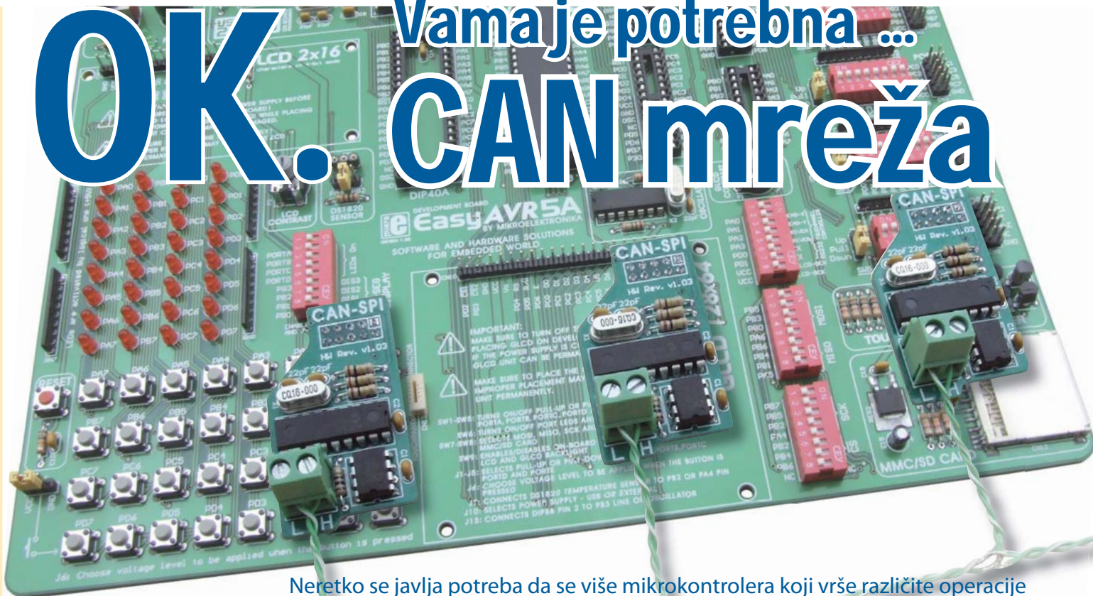
EasyAVR5A razvojni sistem i CAN-SPI moduli

Neretko se javlja potreba da se više mikrokontrolera koji vrše različite operacije integrišu u jedan sistem kako bi funkcionisali kao celina. U ovom tekstu ćemo pokazati kako umrežiti tri mikrokontrolera u CAN mrežu. Takođe, objasnićemo kako se koriste filtri u CAN čvorovima u cilju selekcije poruka.