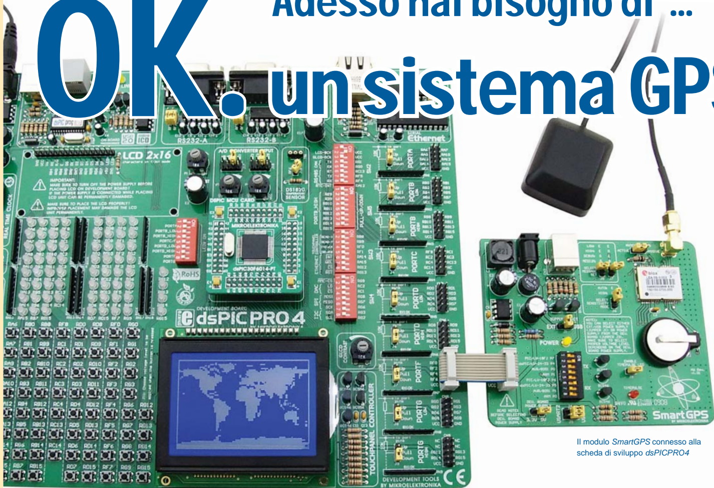
Il modulo SmartGPS connesso alla scheda di sviluppo dsPICPRO4