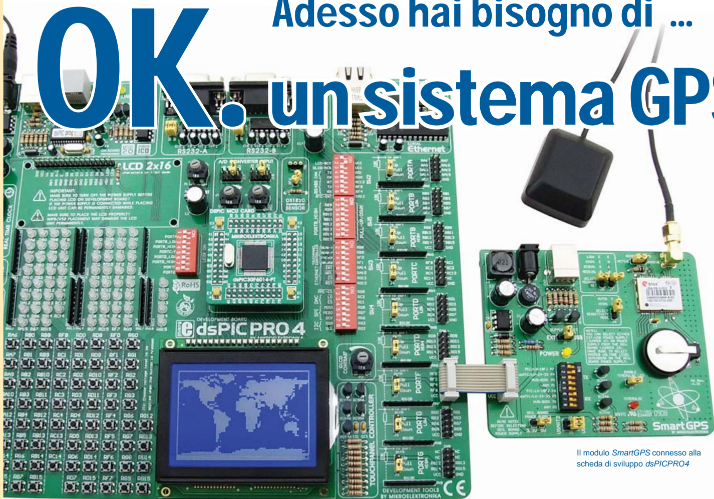
Il modulo SmartGPS connesso alla scheda di sviluppo dsPICPRO4

Di Dusan Mihajlovic MikroElektronika – Dipartimento Hardware