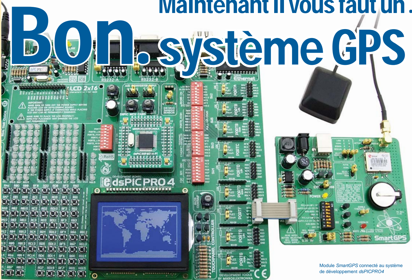
Module SmartGPS connecté au système de développement dsPICPRO4

par Dusan Mihajlovic MikroElektronika - Hardware Department