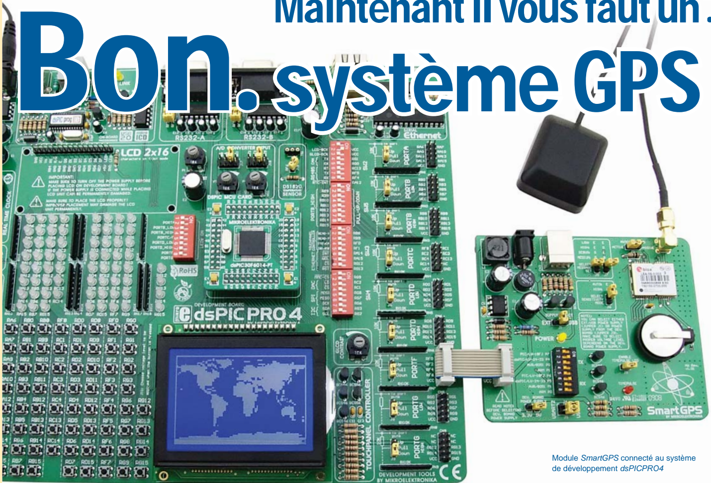
Module SmartGPS connecté au système de développement dsPICPRO4

par Dusan Mihajlovic MikroElektronika - Hardware Department