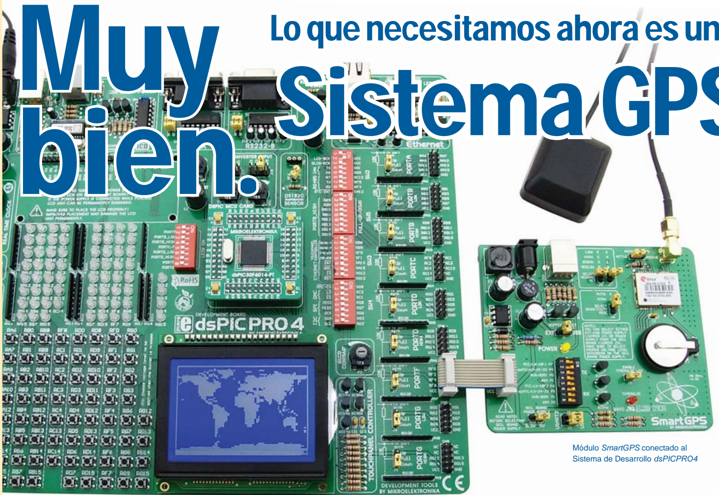
Módulo SmartGPS conectado al Sistema de Desarrollo dsPICPRO4