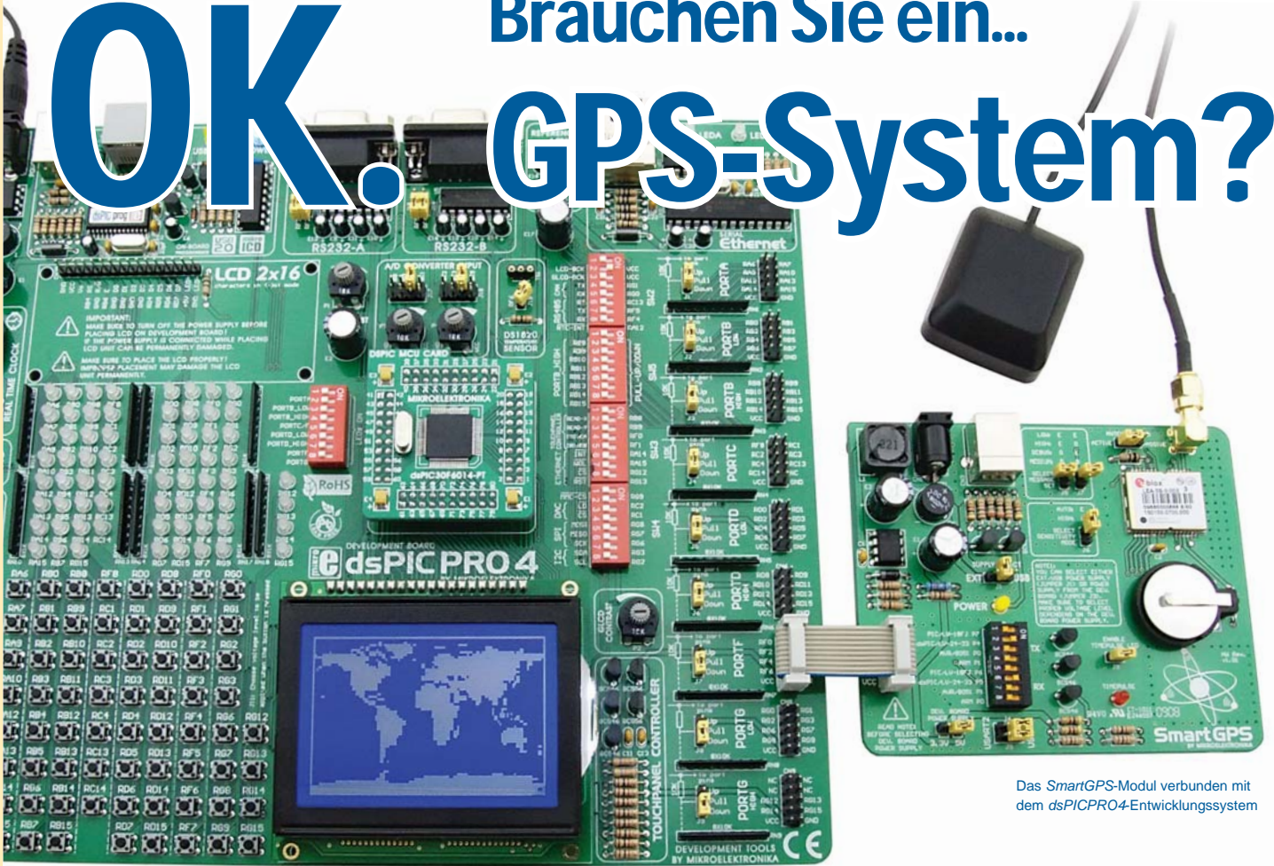
Das SmartGPS-Modul verbunden mit dem dsPICPRO4-Entwicklungssystem

Von Dusan Mihajlovic MikroElektronika Software-Entwicklung