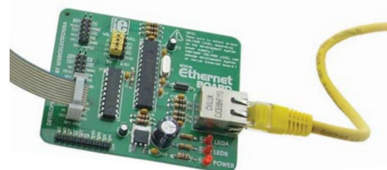
Figure 1. MikroElektronika's Serielles Ethernet-Modul mit ENC28J60 chip

Die Steuerung von Geräten erfolgt prinzipiell, indem die IP-Adresse des Geräts in die Adresszeile des Web-Browsers eingegeben wird und die gewünschten Befehle spezifiziert werden. Selbstverständlich kann mehr als nur ein einziger Pin eines Mikrocontrollers gesteuert werden. Auf diese Weise können viele unter-